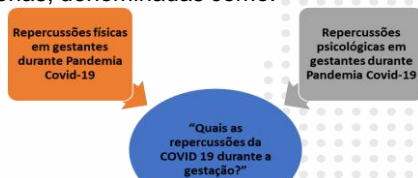
Figura 2. . Categorias temáticas estabelecidas na Revisão Integrativa.

Para sistematizar o conhecimento, utilizou-se da análise temática, sendo assim, emergiram duas categorias, denominadas como: