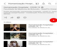
Imagem 2: Registro do canal do Youtube.

Os materiais produzidos foram encaminhados via correio eletrônico e mídias sociais para o público alvo. Tais vídeos também estão disponíveis no canal do YouTube do NEAD.TIS da FMB- UNESP, como ferramenta de fácil acesso para toda a população, ampliando seu potencial conscientizador e educador.