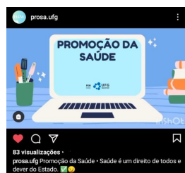
Print 5 - Vídeo sobre Saúde como Direito