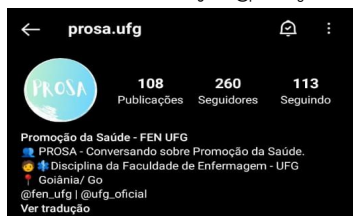
Print 1 - Perfil no Instagram: @prosa.ufg