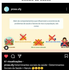
Print 4 - Vídeo sobre Determinantes Sociais da Saúde