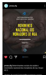
Print 2 - DSS e movimento nacional dos moradores de rua.